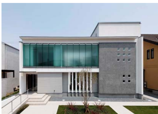
<J・アーバン>2003年グッドデザイン賞受賞

力強く安定感のある下層に、シンプルな平屋をふわりと置いたようなシルエット。緩やかな勾配の切妻屋根と開放感を演出するガラススクリーンが特徴の“美しい浮遊感”を表現した住まいです。