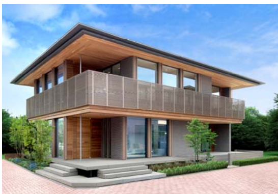
<J・レジデンス>2013年グッドデザイン賞受賞