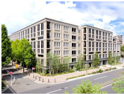
＜シティテラス横浜仲町台壱番館＞