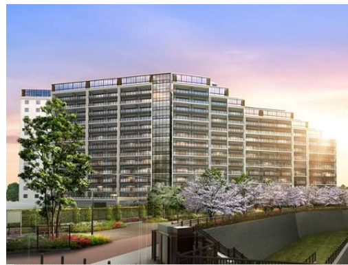
＜シティテラス加賀＞