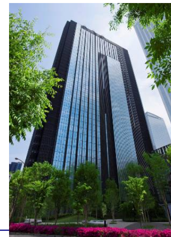
住友不動産新宿 グランドタワー