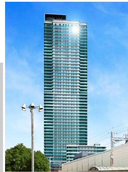
＜シティタワー神戸三宮＞