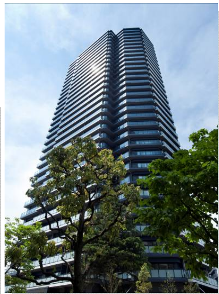
＜シティタワーさいたま新都心＞