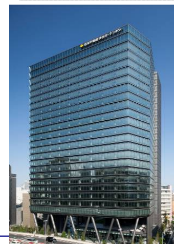
住友不動産渋谷 ガーデンタワー