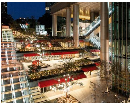
その他催し: クリスマスにちなんだ演奏会実施