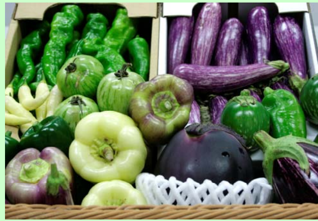
<出展野菜イメージ>