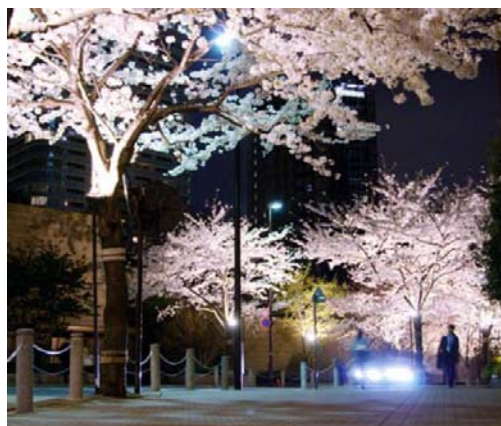
その他催し: 演奏会、スタンプラリー、フォトコンテスト実施