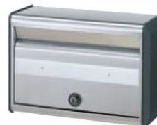
アルミ製・ダイヤル錠付