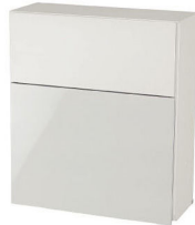
アルミ製・プッシュ錠付