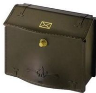
アルミ製・ダイヤル錠付