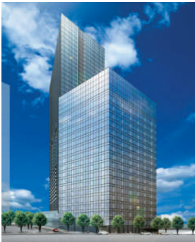
<住友不動産新宿セントラルパークビル完成予想図>