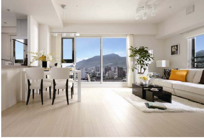
<ダイナミックパノラマウィンドウ・例>

館内に設けた「シティハウス円山裏参道レジデンス」のコンセプトルームでは、開放感と眺望を重視し、足元から天井近くまで壁一面に窓を設けた「ダイナミックパノラマウィンドウ」など、図面だけでは分かりにくい物件の特長を実際にご体感いただくことができます。