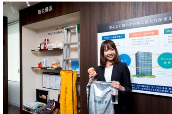
<防災備品紹介コーナー>