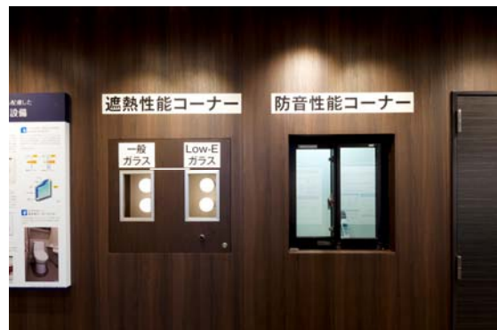
<ガラス性能体験コーナー>