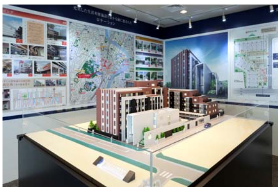
<模型展示コーナー>