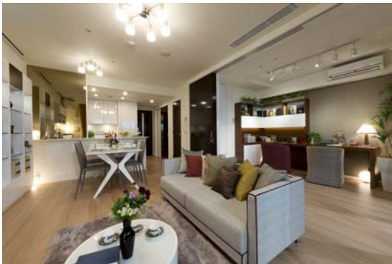
<コンセプトルーム>

図面やパンフレットだけではわかりにくいマンションの間取りや、最新の住宅設備、建具・フローリングといった仕様をご確認いただけるコンセプトルームを2タイプ用意しています。また、販売物件の模型や特長を紹介するパネル展示のほか、防災備品紹介コーナー、ガラス性能体験コーナーなど、実物を体感できる様々な展示コーナーを設けています。