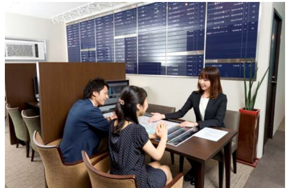
<コンシェルジュデスク>

具体的な物件が決まっておらず、これからマンションの購入を検討する際に気になる部分、予算の決め方や資金計画、価格相場や税制などについてご案内するコンシェルジュデスクを用意しています。“マンション選び”に関する様々な悩みや疑問をお気軽にご相談いただけます。