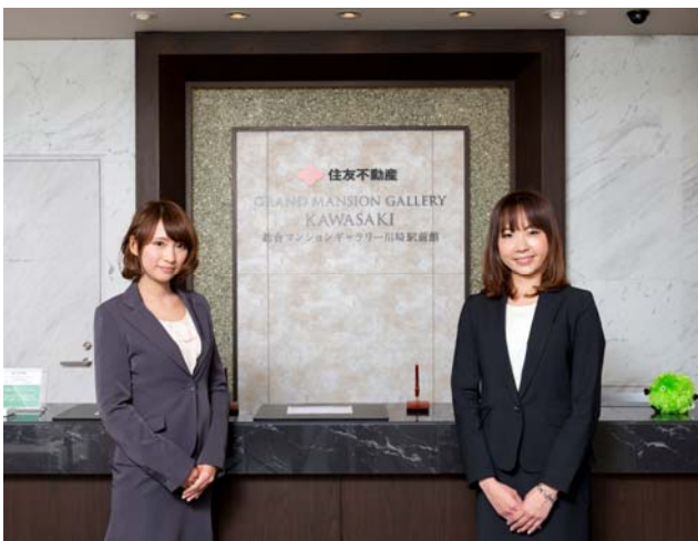
<「総合マンションギャラリー川崎駅前館」受付>