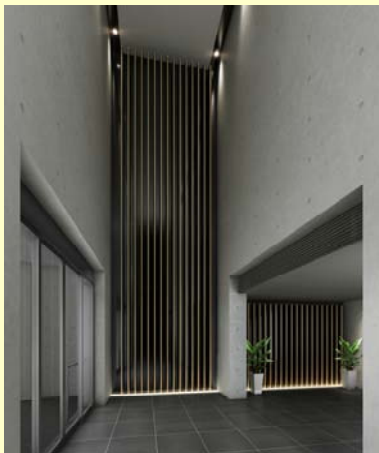
<エントランスホール>

建物外観は、レンガ調タイルとモダンなコンクリート打ち放しの壁面に、バルコニーのガラスという複数のマテリアルを組み合わせ、時を経ても色褪せない落ち着いたデザインとしました。