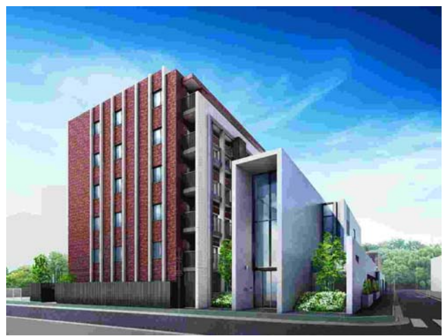
<「シティハウス横濱鶴見ステーションコート」完成予想図>

「総合マンションギャラリー川崎駅前館」では、平成 25 年 4 月 27 日の先行オープン以来、「シティハウス横濱鶴見ステーションコート」を具体的にご検討いただいているお客様やこれからマンション選びを始めるお客様など、これまで 300 組を超える来場があり、年間の目標来場者数 2,000 組に向けて好調なスタートを図れたものと考えております。