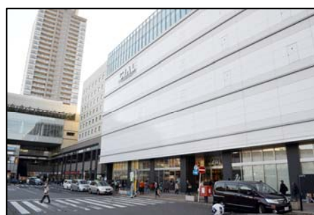
<駅前大型商業施設「シアル鶴見」>