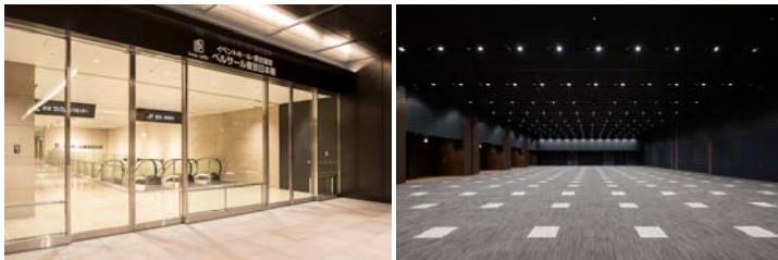
<「ベルサール東京日本橋」 エントランス&ホール>