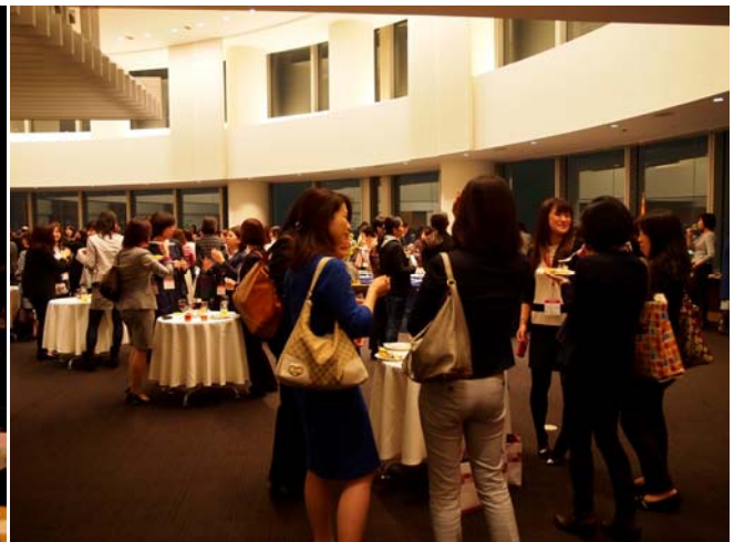
＜ネットワーキングパーティー＞