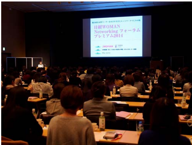
＜前回フォーラムの様子＞

今般、多目的ホールや貸会議室などの管理運営を手掛けている住友不動産ベルサール株式会社(本社:新宿区西新宿 2-6-1、取締役社長 遠藤 毅)が、この 4 月に開設したばかりの「東京」駅至近、「日本橋」駅直結で圧倒的な交通便利性と、1,300 m 2 超のエリア最大級となるイベントホールを誇る「ベルサール東京日本橋」において、 日経 BP 社主催の“働く女性のための学びとネットワークづくりの場”日経 WOMAN『Networking Forum』記念すべき 10 回目フォーラムが、平成 27 年 4 月 18 日(土)に開催されます。 なお、当社は本フォーラムにおいて協賛会社として参画しています。