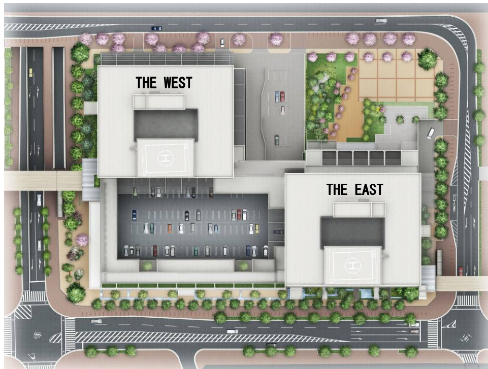
＜建物配置イメージ＞