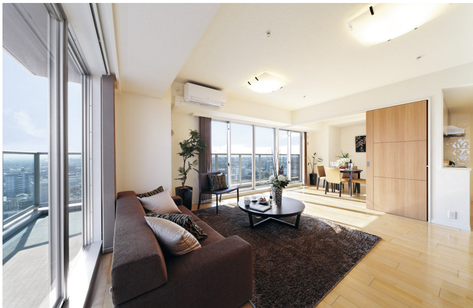
WI-Fa タイプ・13階・リビングダイニング (23年1月撮影)

西日本最大 1,499 戸の新しい街を創造する「メガシティタワーズ」。 それは、あらゆる世代にご満足いただける「オール・エイジ・シティ」です。