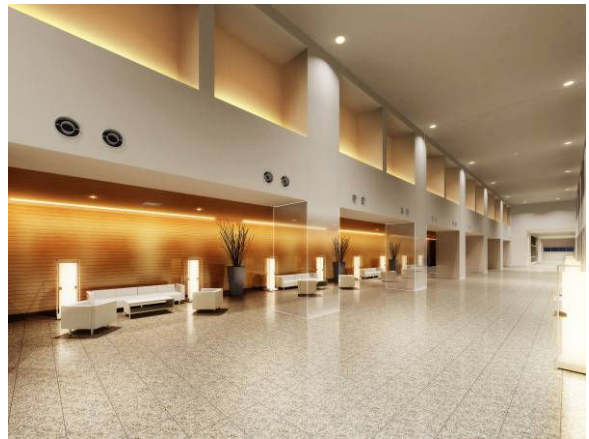
<6F セントラルロビー完成予想 CG>