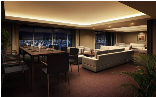
<23階スカイラウンジ完成予想 CG>