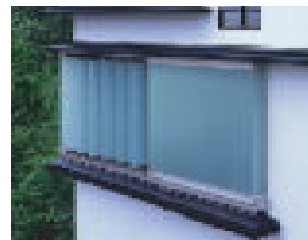
「ガラスルーバースクリーン」