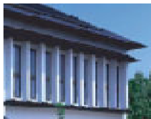
「リズムカルフィン」

外壁面に印象的な陰影を浮かび上がらせる縦スリーブと、連続する窓。ガラス面積を削減するとともに、ガラス面への直射日光を抑える効果も発揮します