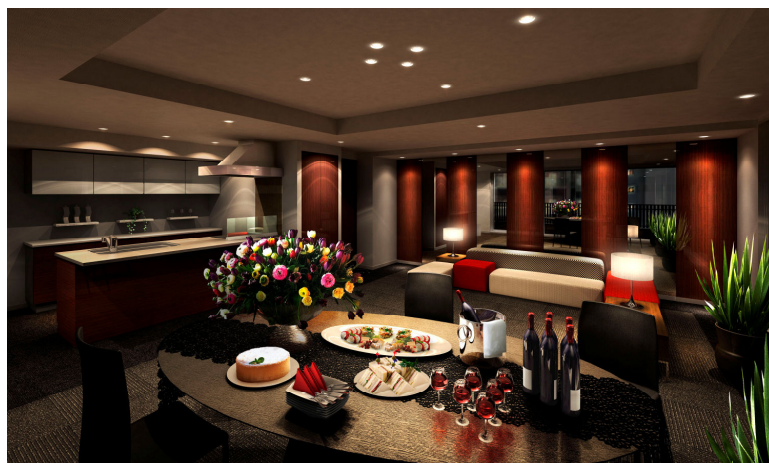
オーナーズルーム完成予想図

11階のオーナーズルームには、シックな装いの空間に、ゆったりと腰を下ろせるソファや会議などにも使えるようテーブルも備え付けており、仲間うちでのホームパーティーなど、さまざまなシーンに合わせてお使いいただけます。