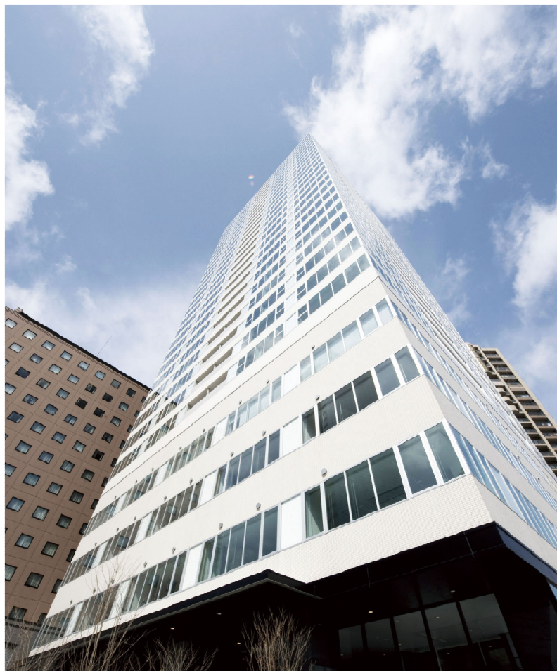
「シティタワー仙台花京院」外観

「シティタワー仙台花京院」は進化を続ける仙台駅前において、過去 10 年間、仙台青葉区内で供給された分譲マンションのなかで J R 「仙台駅」に最も近い分譲マンションとなり、J R 「仙台駅」徒歩 5 分圏内には存在しなかった高さ 29 階建て総戸数 182 戸の超高層タワーレジデンスとして誕生します。（※平成 21 年 11 月電通東日本調べ 高さ 20 階以上の分譲マンションとして）