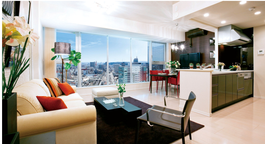
「ダイナミックパノラマウィンドウ」と眺望イメージCG（高さ約90m・27階相当）

さらに分譲戸数146戸のうち、93%を越える137戸が10階以上に配置されているため、都心物件では希少な開放感のある暮らしが実現できます。また、防音サッシを採用し、外部から侵入する音の低減にも配慮しています。