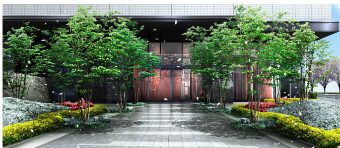
エントランスガーデン完成予想図

また、共用廊下は先進の建築様式「フォレスト・コリドー」を弊社の仙台圏の物件では初めて採用しており、木目調の格子はプライバシー性を高めながらも自然光をとり入れ、通気性にも優れています。