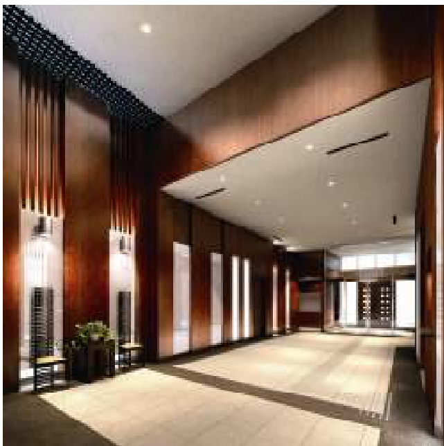
<エントランスホール完成予想図>

12階にはワイドな開口部が印象的で、ホテルのロビーのような上質な雰囲気を漂わせるコミュニティラウンジを設けています。お客様をもてなす場やご家族同士の語らいの場としてご利用いただけます。