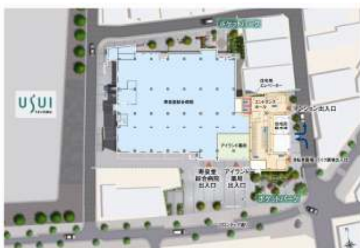
<敷地配置図イメージイラスト>