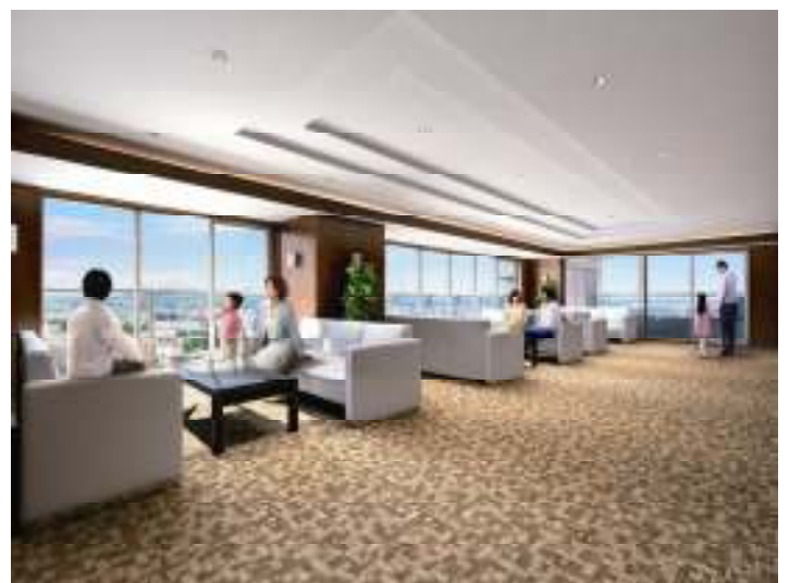
<コミュニティラウンジ完成予想図>