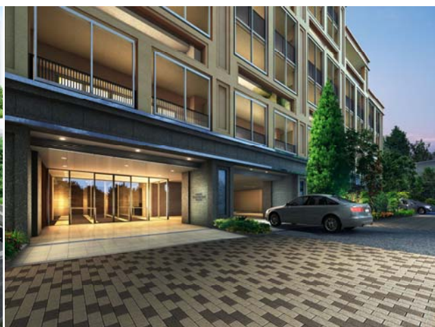
<エントランス完成予想図>