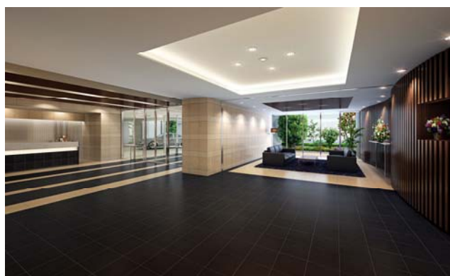
<エントランスホール・ラウンジ完成予想図>

マンションの顔となるメインエントランスホールは、壁面に天然石をレイアウトし、折上げ天井を採用した広々とした空間に設えました。ステイタス感溢れるデザインは住まう方に誇りを抱かせ、豊かなライフステージを象徴する場所となります。さらにガラスカーテンウォールの明るく開放的なスペースにはラウンジをご用意しており、待ち合わせの際などにご利用いただけます。