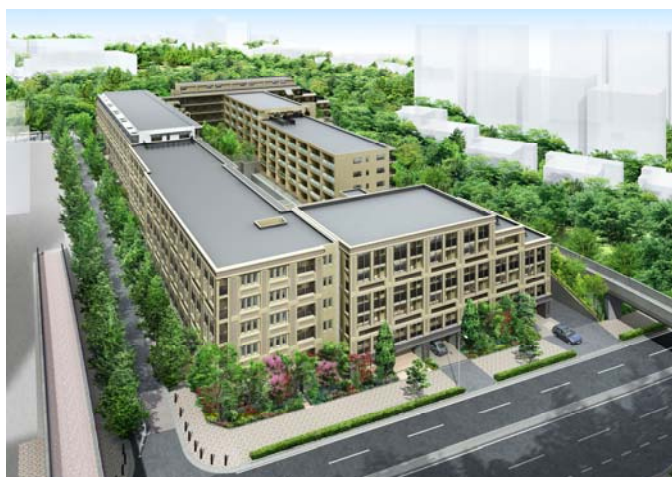
<建物外観完成予想図>