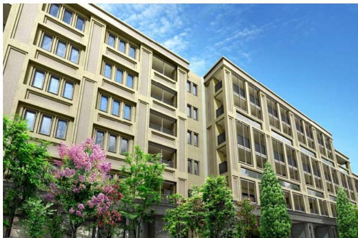
<建物外観完成予想図>

ファサードは柱・外壁・窓枠にいたるまで立体的な造形を意識しました。壁面は、窓枠と柱で構成されたグリッドデザインにより、2層分が1層に見える特徴的なデザインを採用し、基壇部には天然石を張り、建物の重厚感を演出しています。深く刻まれた彫、味わいを深める素材、微にこだわり美を磨いた外観デザインは、ヨーロッパの由緒ある洋館のように洗練された雰囲気を感じ、時を経る程に、クラシカルな価値を深める建築を目指しています。港北ニュータウンの美しい街並みと周囲の緑に調和した個性的なデザインは、お客様から高くご評価いただいています。