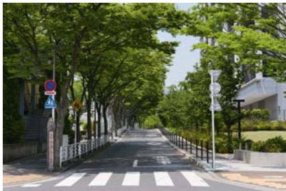
<敷地北側の並木道>

周囲は、都市利便が充実したポジションにありながら、建物の北側メインアプローチに豊かな街路樹が彩る並木道があるほか、お子様が安心して遊べる「都立木場公園」、「夢の島公園」などの大規模公園や、散策やジョギングを快適に楽しめる約 1.2km の汐浜運河沿い遊歩道「潮風の散歩道」など、豊富な緑と水辺の自然溢れる潤いの環境が整っています。