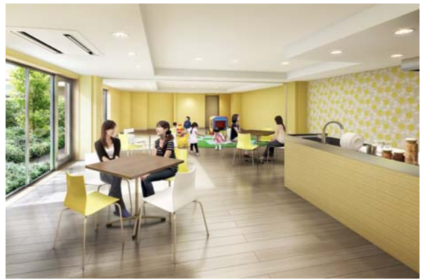
<キッズルーム&パーティールーム>