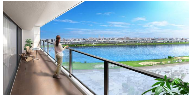
<バルコニーから臨む荒川方面の開放的な眺望イメージ>