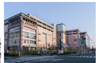
<南砂町ショッピングセンター SUNAMO>