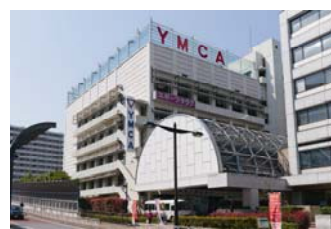
<東京 YMCA ウェルネスセンター>