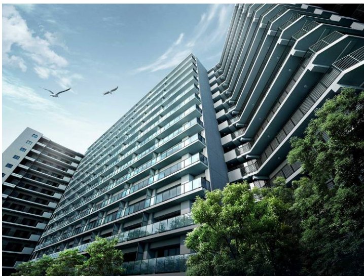
<シティテラス平井 外観イメージ>