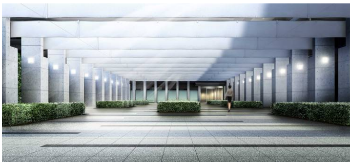
<エントランスまでの迎賓空間として設けた「グランドパティオ」イメージ>