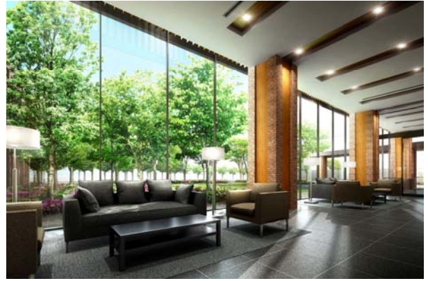
<上図:エントランスホールイメージ、下図:エントランスイメージ>

エントランスは、建物を際立たせる重厚な柱に支えられた大きな庇が印象的に映る車寄せを配し、格式ある迎賓の空間に相応しいデザインとしています。エントランスホールは、豊かな芝生と樹木の緑を臨む公開空地（くうち）側に煉瓦調タイルを纏う柱と、高さ約 4.5m の天井近くまで届くガラスウォールを設え、開放感のあるくつろぎの空間を演出しています。