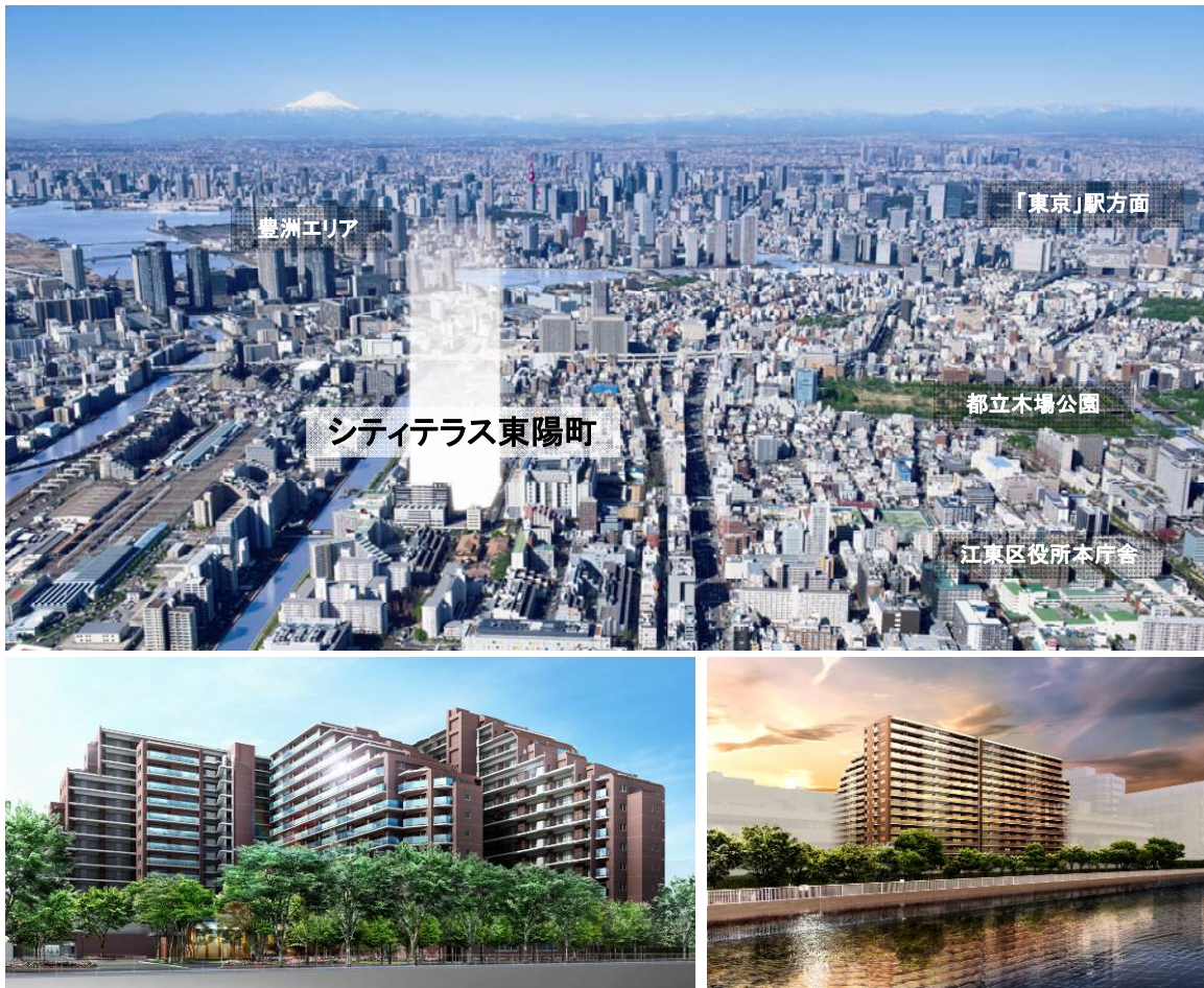
<上図:物件周辺イメージ、下図:建物外観イメージ (左)北側 (右)南側>

住友不動産株式会社（本社：新宿区西新宿 2-4-1、代表取締役社長：仁島 浩順）は、都心部までスピーディなアクセスが可能、商店街から大型商業施設まで身近に集積する高い生活利便性に加え、周辺の大規模公園や、敷地北側に配された緑豊かな並木道、南側に流れる運河など自然の潤いまで享受できる卓越した住環境を有した東京メトロ東西線「東陽町」駅徒歩 5 分の広大な敷地に「シティテラス東陽町（総戸数 522 戸）」の建設を進めており、このたび、営業拠点となる「総合マンションギャラリー 秋葉原館」において、 平成 27 年 5 月 30 日(土)よりモデルルームの一般公開 を始めることとなりましたので、お知らせします。