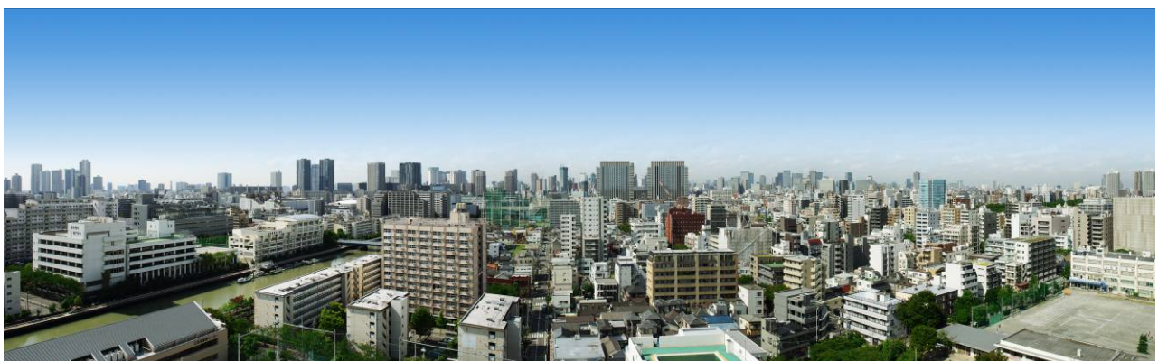
<西側、都心ビュー写真(現地 15 階相当)>