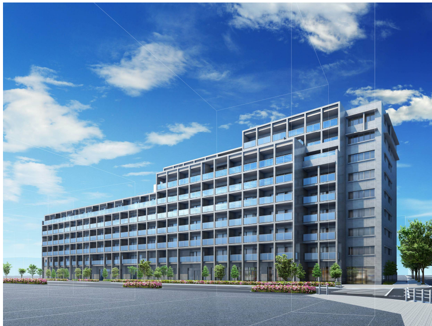
<シティハウス仙川ステーションコート完成予想パース>

なお、弊社と安藤忠雄建築研究所によるコラボレートは、「シティハウス仙川」（平成16年5月竣工・総戸数61戸）に次いで2棟目となります。