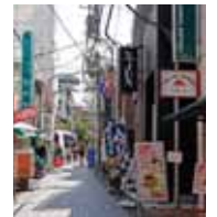
<ハーモニータウン仙川>

「仙川」駅周辺は駅前再開発によってきれいな街並みに生まれ変わり、個性豊かなショップやカフェなどが点在するファッションナブルなエリアになっています。現地から徒歩4分圏内には「クイーンズ伊勢丹」「西友」「京王ストア」「ライフ」「丸正」の5つのスーパーマーケットが集中しており、約200以上の店舗が集う商店街「ハーモニータウン仙川」や昨年オープンした「島忠ホームズ仙川店」と合わせて日々の暮らしをサポートします。