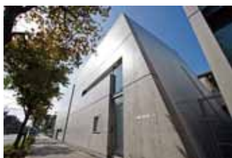
＜東京アートミュージアム＞