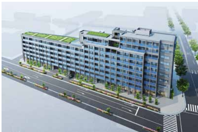
＜外観完成予想パース＞

建築物の断熱性や景観の向上を図るとともに、通り沿いのハナミズキの並木と緑の美しい連鎖を形成するよう地球環境やエコロジーにも配慮した屋上緑化を計画しています。建物のフォルムや造形の美しさを意識したモノトーンの外観に対して、ファサードの前面には、屋上緑化の流れを受けて四季折々の花々や緑が彩りを添える植栽を施しました。季節ごとに移り変わる植栽の色彩が、ファサードの趣きと居住性に潤いを添えます。