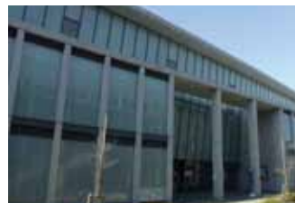
＜調布市せんがわ劇場＞