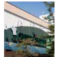
<クイーンズ伊勢丹>