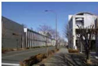
＜安藤忠雄ストリート＞

安藤忠雄建築研究所が設計した集合住宅・美術館・劇場などが建ち並ぶ、全長約500mに及ぶハナミズキに彩られた街路、通称“安藤忠雄ストリート”は、シンプルなコンクリート打ちっぱなしの建築とハナミズキの緑が調和し、美しい街並みを形成しています。この街並みの中には「東京アートミュージアム」や「調布市せんがわ劇場」といった、気軽に芸術や文化に触れることができる施設が集積しており、芸術性と文化性の高いエリアとなっています。