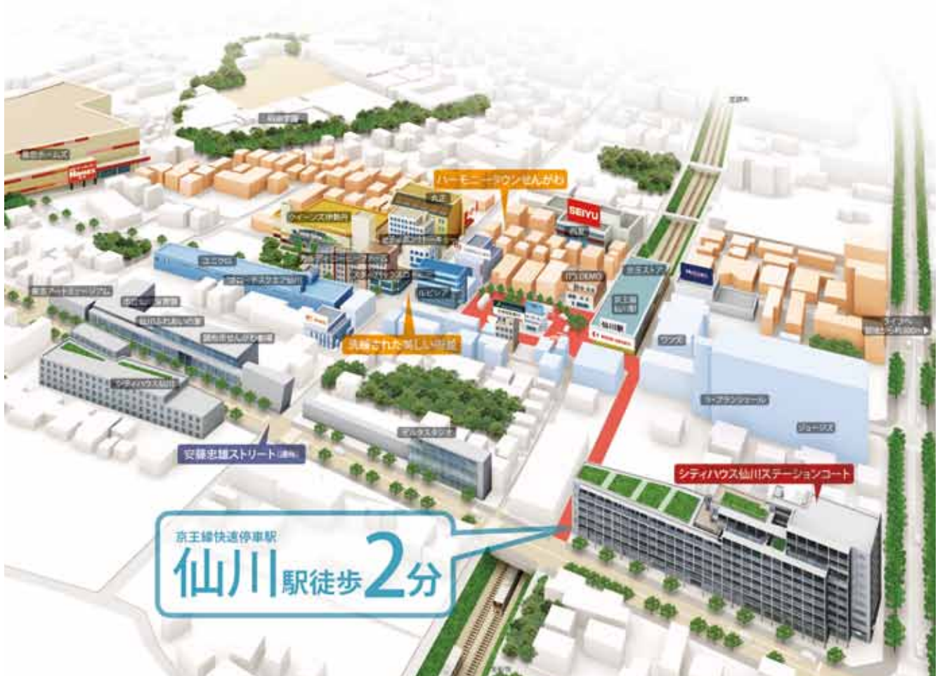
<立地概念イラスト>