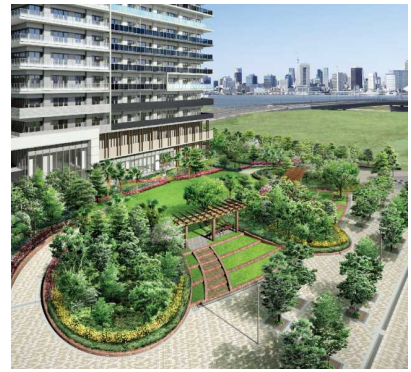
[ オーバルガーデン完成予想 CG ]

ランドスケープに求めたのはリゾート感あふれる豊かなオープンスペースと色彩豊かな植栽計画です。多様な植物たちが有明の四季をリードし、洗練のタワー建築との調和を形成するボリュームのある樹林が、高木・中木・低木を組合せて多様な樹林を創出しています。顔となる東側には芝生広場のある「オーバルガーデン」があり、周りの大きな樹林「オーバルボスク」の足元に展開する四季の植物を楽しみながら散歩したり、芝生でのんびりしたり、夏はパーゴラの下で日陰を見つけたり、季節ごとの楽しみが見つかる場所といたしました。