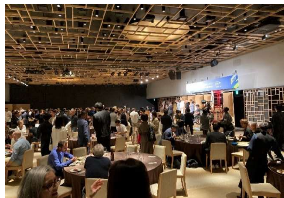
▲過去開催のレセプションパーティー様子