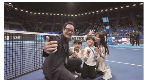
▲抽選で当たるオンコート記念撮影イメージ

※コイントス、エスコートキッズの抽選は、8月31日(日)までに購入された方が対象です。