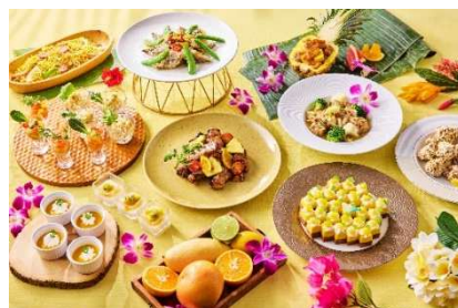
和洋中buffetが揃うレストラン