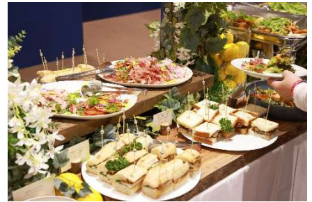
▲「ホスピタリティプログラム」のサービス。左から座席でのドリンクサービス、お土産イメージ、専用ラウンジでのbuffeイメージ