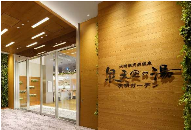
泉天空の湯 有明ガーデン 入口

https://www.shopping-sumitomo-rd.com/ariake/spa-izumi/