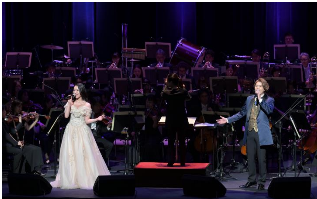
『第120回サマーステップコンサート』(2025年7月実施)の様子