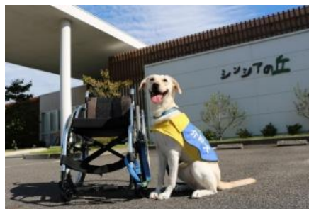
介助犬のイメージ写真

当日は、介助犬育成・普及のための募金箱を会場に設置します。「ステップコンサート」では、1995年1月17日に起きた阪神・淡路大震災から義援金活動を始め、2004年以降は、社会福祉活動のため「介助犬の育成・普及」に少しでもお役に立ちたいと会場で募金活動を行っております。皆様より寄せられた募金は、社会福祉法人日本介助犬協会へ寄託し、介助犬育成・普及のための活動に活用します。