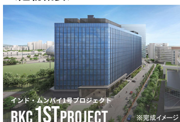
インド・ムンバイ1号プロジェクト BKC 1ST PROJECT