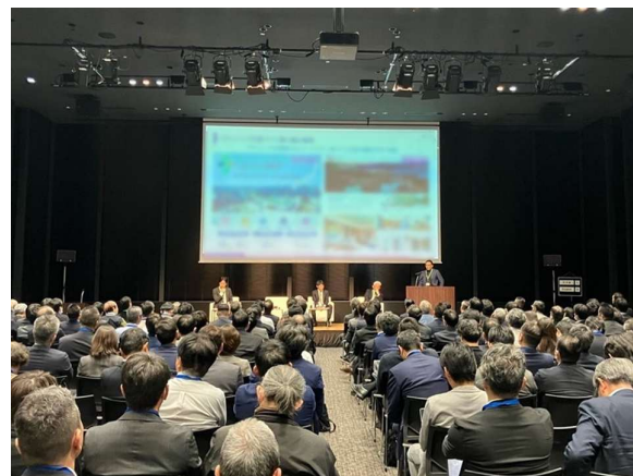
(過去開催の様子) 左:ご登壇のインド大使館公使(経済・商務担当)、右:インド進出の大企業4社によるセッション