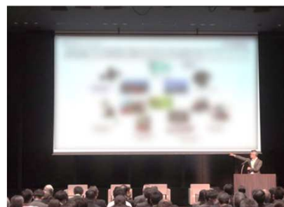
(過去開催の様子) インド進出済の企業によるプレゼン

本イベントでは、「人材活用」をテーマに、すでにインドへ進出している日本企業による、現地人材の採用・育成、組織マネジメント、拠点運営における具体的な取り組みをご紹介します。