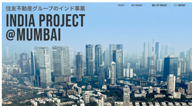
ムンバイ ワーリーのビル群

今年の秋にはBKC地区において第1号計画の「 BKC 1ST PROJECT 」が竣工予定です。