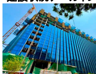
建設状況アーカイブ