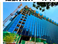
建設状況アーカイブ