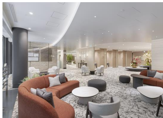
ハウジングプラザ日本橋(日本橋営業センター) ラウンジ