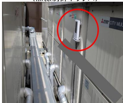
〈無線制御ボックス〉