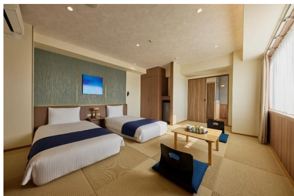
▲客室タイプ「瑠璃—RURI—」一例。35㎡の客室には布団を2セットご用意。4名様まで一緒に泊まることができます。