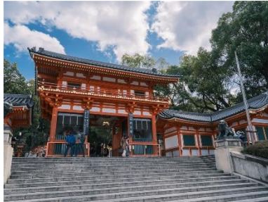
▲八坂神社