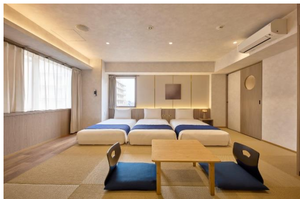
▲客室タイプ「霞—KASUMI—」43㎡の客室は、三点独立式のバスルームで親子三世代旅行でも快適にお過ごしいただけます。

ヴィラージュ京都は、2025年3月に大部分の客室をリニューアルし、最大6名様でご宿泊できるゆとりある43㎡の客室をはじめとした合計6タイプの客室をラインアップしております。家族3世代で集まる旅や、友人と過ごすグループ旅において、同じ空間に集まり同じ時間を過ごすことができる客室タイプもご用意し、用途に応じた快適な滞在体験をご提供いたします。