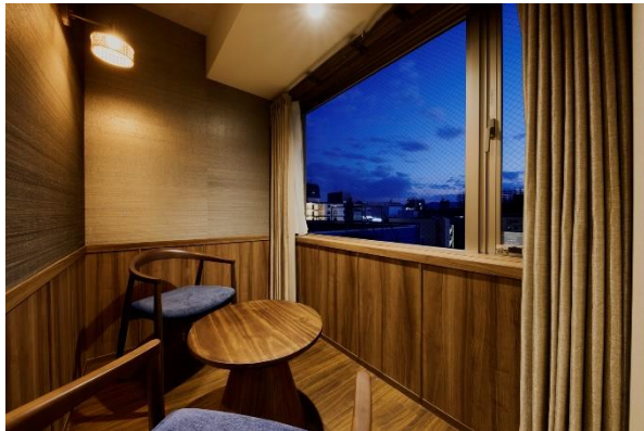
▲「瑠璃—RURI—」くつろぎスペース一例。

各客室には、京都の職人によって織られた壁紙や、部屋の名前をモチーフとしたアート、日本古来から繁栄や幸福を象徴する縁起の良い形とされてきた八角形を光で演出するライトを取り入れており、より上質な京都でのホテル滞在を彩ります。