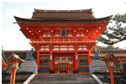
▲伏見稲荷大社