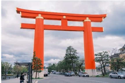
▲平安神宮