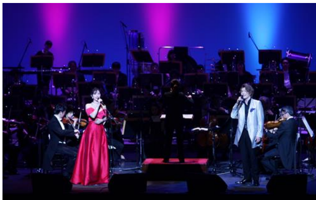
『第117回サマーステップコンサート』(2024年7月実施)の様子