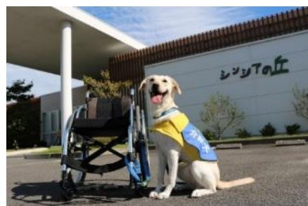
介助犬のイメージ写真

当日は、介助犬育成・普及のための募金箱を会場に設置します。「ステップコンサート」では、1995年1月17日に起きた阪神・淡路大震災から義援金活動を始め、2004年以降は、社会福祉活動のため「介助犬の育成・普及」に少しでもお役に立ちたいと会場で募金活動を行っております。皆様より寄せられた募金は、社会福祉法人日本介助犬協会へ寄託し、介助犬育成・普及のための活動に活用します。