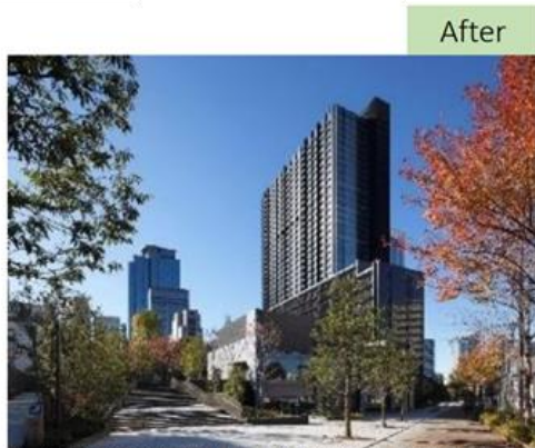
▲ ゆとりのある街区整備が行われた開発後の西新宿八丁目成子地区 (住友不動産新宿グランドタワー)

土地の高度利用による街のにぎわい向上や地域インフラの整備といった地域貢献に取り組み、持続可能な地域・コミュニティ形成に寄与