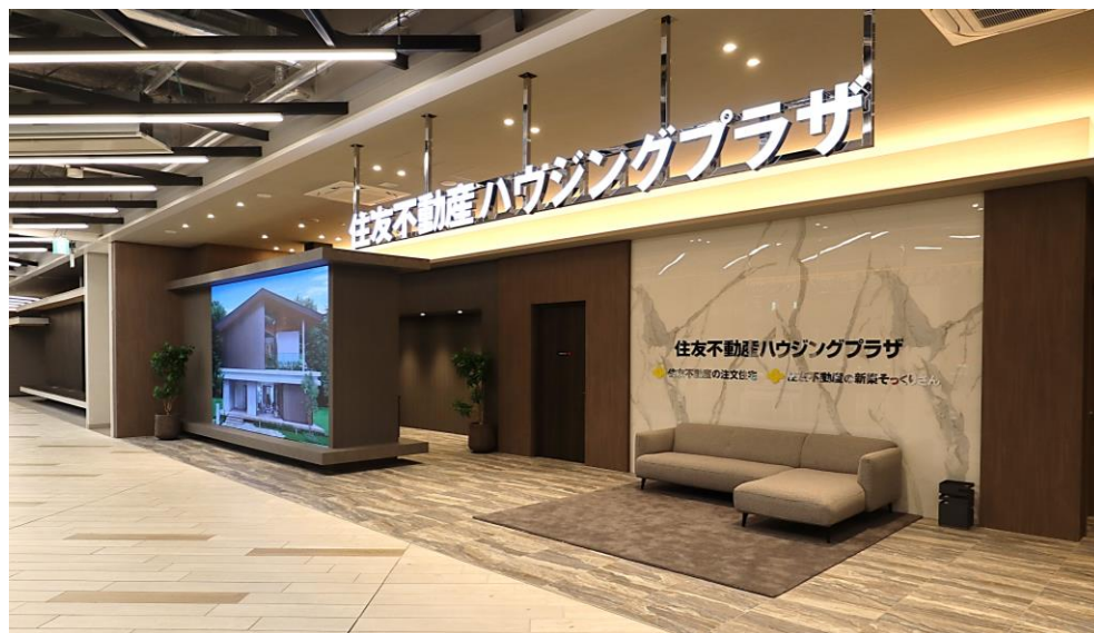
新会社初店舗の一つ「住友不動産ハウジングプラザ有明」共有エントランス

新会社「住友不動産ハウジング」は、この難度の高い事業から逃げずに正面から挑戦するために、両事業の強みを融合し、施工パートナーと共にお客様目線でのベストな提案にこだわり続ける集団として、新たにスタートしてまいります。