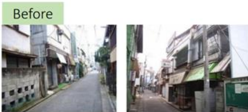
▲ 木造建物が密集していた開発前の西新宿八丁目成子地区

土地の高度利用による街のにぎわい向上や地域インフラの整備といった地域貢献に取り組み、持続可能な地域・コミュニティ形成に寄与