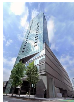
住友不動産西新宿ビル5号館