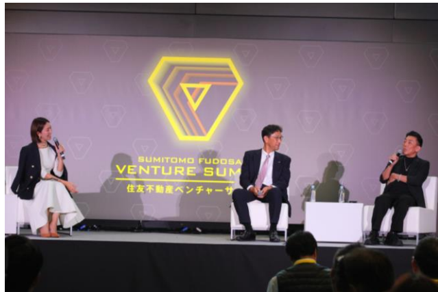
セッションの様子