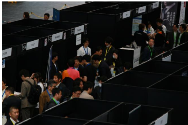
展示ブースの様子