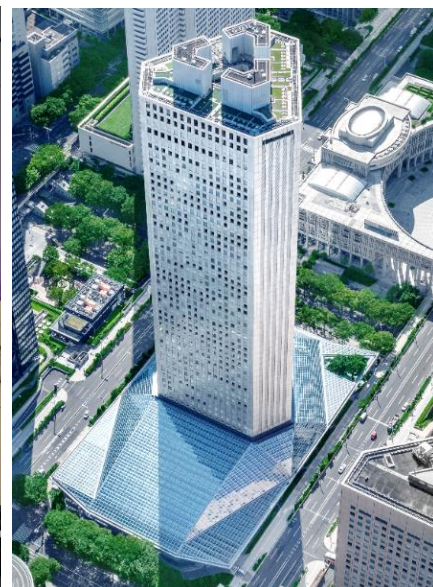
新宿住友ビル 外観

当社が主催する本イベントの最大の特長は、事業会社からの参加者数が多いことにあります。通常のスタートアップイベントでは、スタートアップとベンチャーキャピタルのみが集まるケースが少ない中で、昨年の「住友不動産ベンチャーサミット」では、事業会社からスタートアップ企業を上回る670名の皆様にご参加いただきました。参加者からは「ここまで多くの事業会社が参加しているイベントは見たことがない」などご好評いただきました。スタートアップ企業の成長には、資金面をサポートする金融機関だけでも販路や協業先としての事業会社だけでも不十分です。スタートアップ企業を含めた3者が互いに交わることで加速度的な成長を成し遂げることが可能になります。