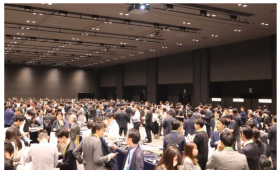
昨年の懇親会の様子

午前・午後それぞれのコンテスト表彰後には、新宿住友ビル内の新宿住友ホールにて立食形式での懇親会を開催いたします。イベント中に興味・関心を持った企業に対して直接アプローチすることができ、協業や資金調達に向けた忌憚のない意見交換をしていただける場となります。