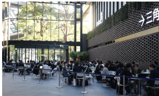
昨年の商談ブースの様子

事前にイベント専用サイトで参加者名簿を公開し、当日までにマッチングが成立した企業同士が商談に使っていただけるブースを設置いたします。昨年は334件の商談機会を参加者の皆様へご提供し、多くの企業様から協業実現のお声をいただきました。