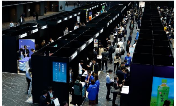
昨年の展示ブースの様子