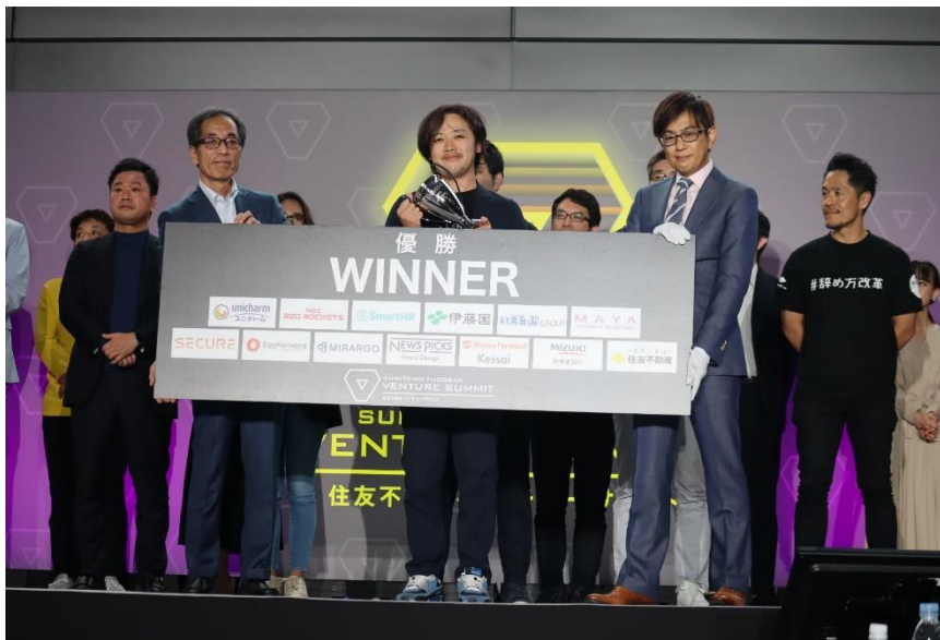
「住友不動産ベンチャーサミット2023」の様子

住友不動産株式会社(本社:東京都新宿区、代表取締役社長:仁島 浩順)は、2024年10月29日(火)に、新宿住友ビル三角広場において、昨年1,600名超が参加した巨大ビジネスマッチングイベント「住友不動産ベンチャーサミット」の第2回を開催いたしますのでお知らせいたします。