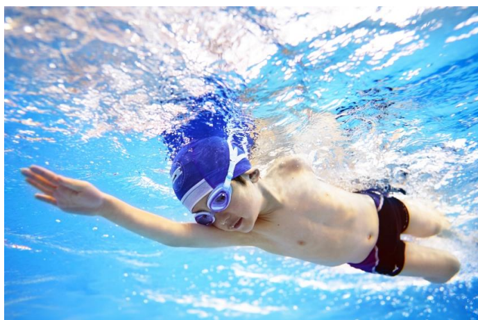
自ら考えて泳法を改善

従来のスイミングスクールでは、指導者が生徒に対して口頭、時には身振り手振りを交えて指導することが一般的でしたが、生徒にとっては「自分の泳ぎのどこが間違っているのかわからない」など、上達に向けたハードルも確かに存在していました。今回導入する「スマートスイミングレッスン」では、指導者が動画を通じて個々に具体的なアドバイスを伝えるだけでなく、生徒自らが自分の泳ぎを確認・客観視することができるため、一方通行の指導にとどまらない自主的な学習をサポートできます。①自分の泳ぎ方を確認して自らの課題を考え、認識する②レッスンを通じて改善点や目標をコーチとともに設定する③設定した改善点や目標を実践するというサイクルを効率的に実施することで、スピーディーな泳力強化はもちろんのこと、「自らの課題に向き合い改善する」という自主性そのものを向上させることも期待できます。