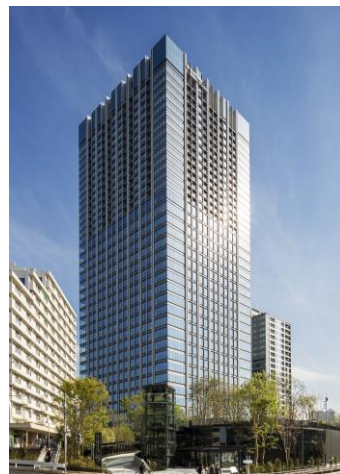
<住友不動産新宿ガーデンタワー>