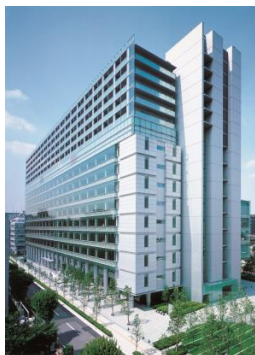
<住友不動産飯田橋ファーストビル>