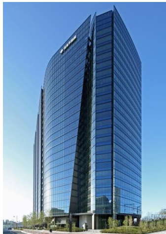
<住友不動産大崎ガーデンタワー>