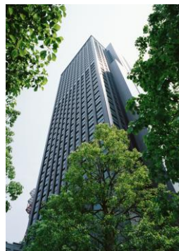
<住友不動産芝公園ファーストビル>