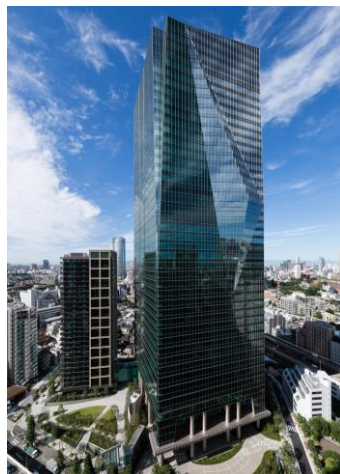
<住友不動産六本木グランドタワー>

加えて、今般の「ZEB Oriented」認証取得のみならず、「DBJグリーンビルディング」認証をはじめとする第三者認証の取得によって省エネビルの普及・拡大にも努めてまいります。