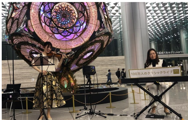
アートオブジェ前でのヴァイオリンとピアノによる二重奏

今回の公演では、会場にて期間限定で展示しているアートオブジェ「櫻小町」のもと、オフィスビル勤務者や駅前広場を歩き交う方々に、生演奏による心豊かなひとときを提供しました。