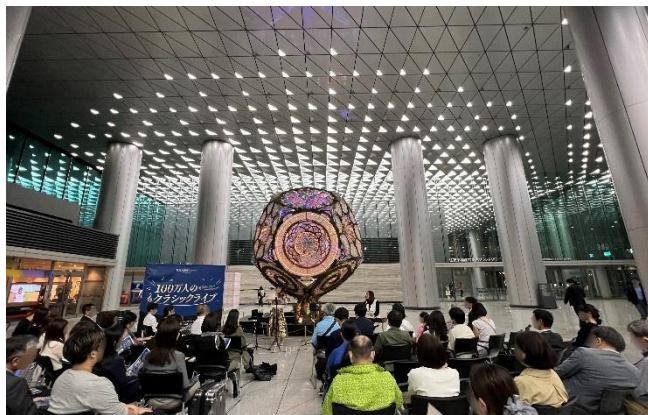
「住友不動産六本木グランドタワー」での初回公演の様子