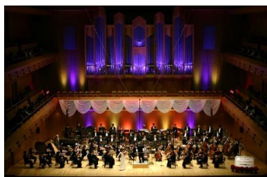
『第115回クリスマスステップコンサート(東京公演)』 千住 真理子氏と新日本フィルハーモニー交響楽団の演奏

本格的なクラシックコンサートを誰でも一緒に楽しめるよう、全席無料でお客様をご招待する「ステップコンサート」。国内外で活躍する指揮者や演奏家、オーケストラを迎え、1987年の第1回開催から30年以上開催を続け、累計26万人超の方々にクラシック音楽をお届けしています。本コンサートは児童福祉向上のための特に優れたコンサートであるとの評価から、1996年より「厚生労働省 社会保障審議会特別推薦 児童福祉文化財」にも指定されています。