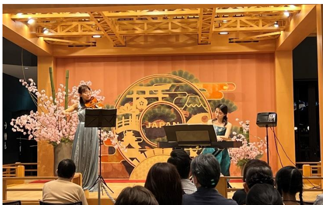
ヴァイオリンとピアノの二重奏を間近に

2024年3月の訪日客数が単月過去最高の300万人超（日本政府観光局発表）となるなか、日本の玄関口・羽田空港第3ターミナル直結の当社施設において、本格的なクラシック音楽に触れる機会を提供することで、国内外の施設来館者に対し心地よい滞在時間をお届けして参ります。