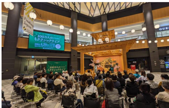
「羽田エアポートガーデン」での初回公演の様子