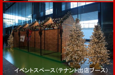
イベントスペース(テナント出店ブース)