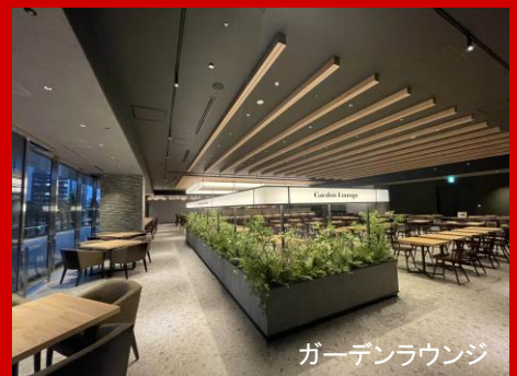
ガーデンラウンジ