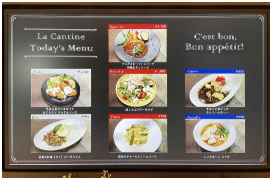
オープン当日のメニュー

通常はオフィスワーカーを中心とした来街者へ昼食を提供する場となりますが、地域・街区でのイベントの際には、本カフェテリアをイベントスペースとして提供し、地域内の交流促進に貢献してまいります。