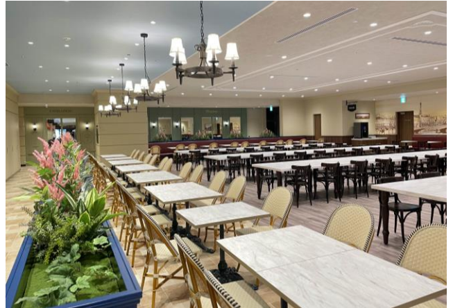
カフェテリア内装

テナント共用のカフェテリアのため、社内のコミュニケーションを活性化するとともに、テナント間の交流も期待できるため、オフィスビル内の出会いを創出する場としても活用いただけます。