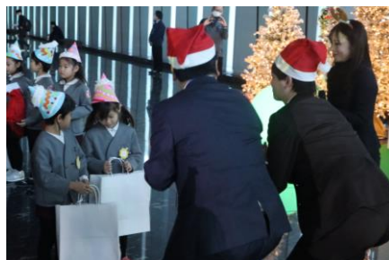
点灯式当日の様子