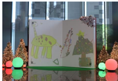
スクリーンに投影される園児たちの絵

当社はこれまでも隣接する「住友不動産三田ツインビル西館」の庭園の芝桜(約6万株)が見頃となる4月下旬から5月上旬に、毎年「芝ざくら祭り」を開催するなど、地域と連携したイベントを行ってきておりますが、「東京三田ガーデンタワー」竣工を機に、より一層地域の方々に親しまれるビル運営に努めてまいります。