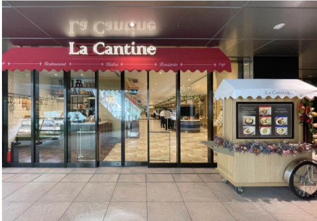
カフェテリア外観

本カフェテリア“La Cantine”では、パリの街並をイメージした非日常的な内装空間の中で、良質かつリーズナブルな食事を楽しんでいただけます。メイン7種、サイドメニュー10種のメニューラインナップを日替わりで提供するため、毎日訪れても飽きることなく気分に合わせてメニューをお選びいただけます。