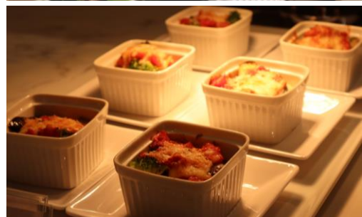
オープン当日サイドメニュー