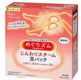
めぐりずむ 蒸気でじんわり 足シート