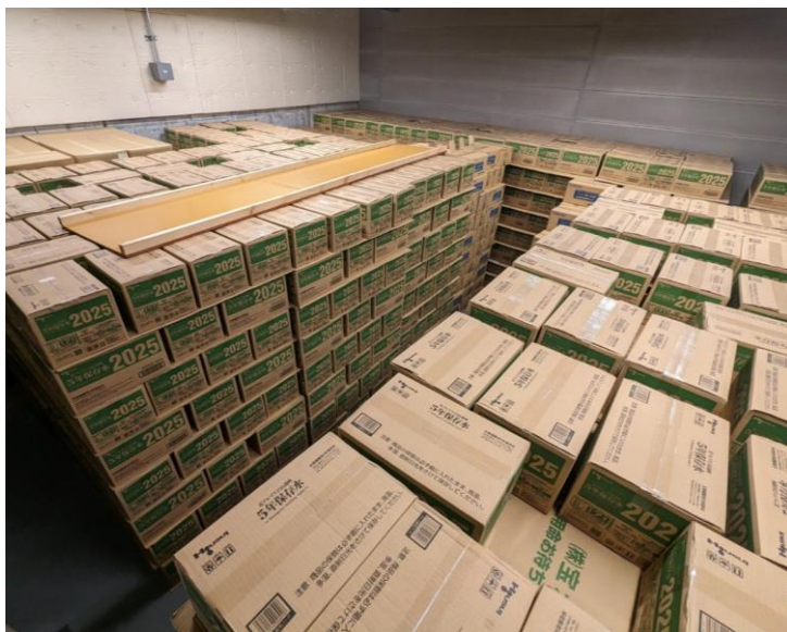
新宿住友ビル 防災備蓄倉庫

大規模災害の発生時、最長で3日間の施設内滞留が想定される中、これまで最低限だった備蓄品に衛生製品を導入することで、「清潔性確保」・「リラックス」の効果が期待されます。これにより、災害の不安をできる限り軽減し、より一層安心して過ごすことのできる街づくりを進めてまいります。