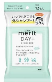
メリットデイプラス ドライシャンプーシート