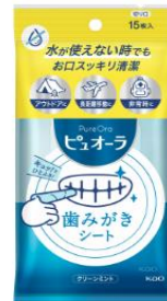
ピュオーラ 歯みがきシート