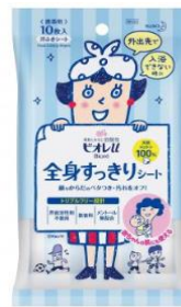
ビオレu 全身すっきりシート携帯用