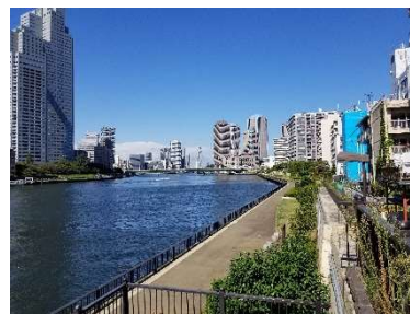
隅田川と商店街をつなぎ、 更なるエリアの賑わい創出へ(2020年9月撮影)