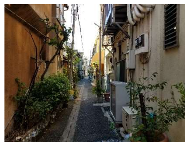
木造住宅密集地を解消し、防火機能の強化へ (2020年9月撮影)