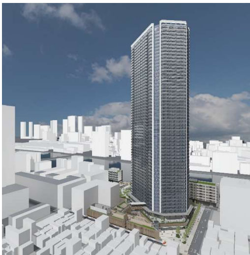
建物外観完成予想図

本事業は市街地再開発事業として着工しており、周囲の特性や環境等に配慮し、住宅・店舗・保育所・デイサービスが入る地上58階建てのタワーマンションを中核としたA街区、低中層建築物によるB-1街区(障がい者グループホーム等)・B-2街区(住宅他)の構成で建築を進めております。