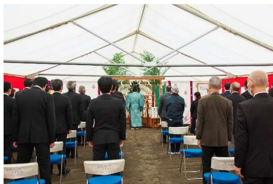
安全と繁栄を祈願する儀の様子

2022年10月13日(木)に開催されました起工式では、再開発組合理事や参加組合員である住友不動産(株)、東京建物(株)、大和ハウス工業(株)、一般財団法人首都圏不燃建築公社、設計・施工者である、五洋建設(株)、(株)大建設など、約30名が参列いたしました。地鎮の儀では、地元住吉神社宮司により、工事の無事や安全と、再開発により新築される施設や月島エリアの繁栄が祈願されました。