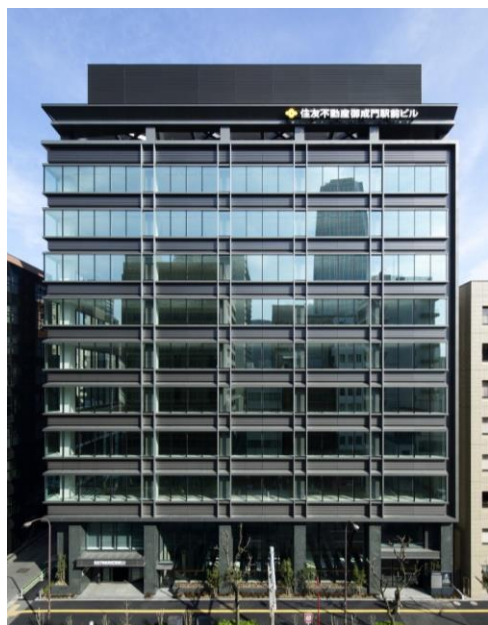
優秀賞を受賞した住友不動産御成門駅前ビル外観

当社は、今後も「環境・社会に配慮した性能」を有する価値の高い社会資産を創造し、より一層持続可能な社会の実現に貢献してまいります。