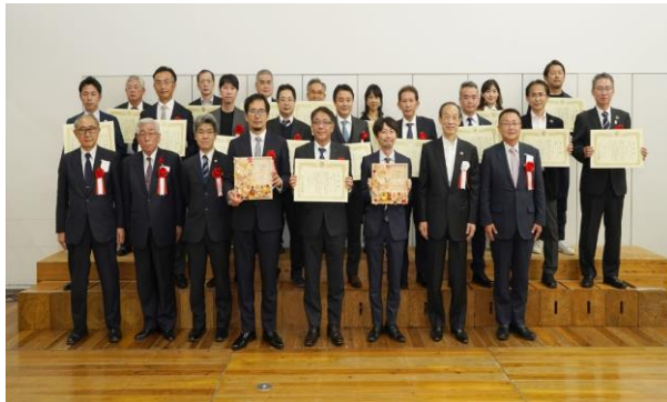
「みなとモデル二酸化炭素固定認証制度」表彰式 集合写真