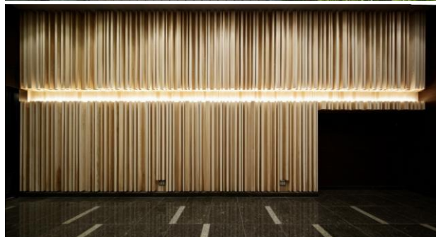
上：住友不動産御成門駅前ビル ウッドデッキ(西予市産ヒノキを活用) 下：住友不動産御成門駅前ビル ホワイエ(浜松市産 スギ無垢材を活用)