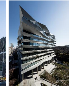
住友不動産 麻布十番ビル