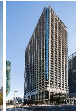
東京日本橋タワー