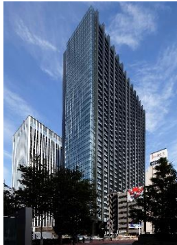
住友不動産 新宿グランドタワー