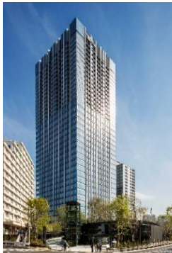
住友不動産 新宿ガーデンタワー