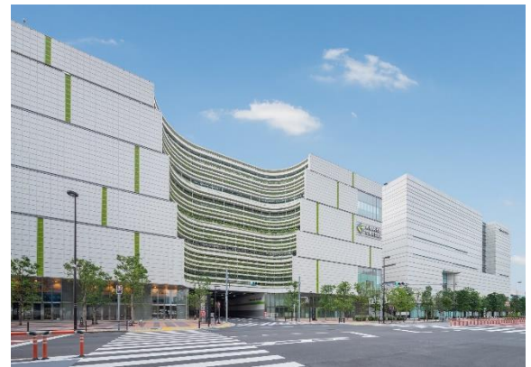
<有明ガーデン外観>