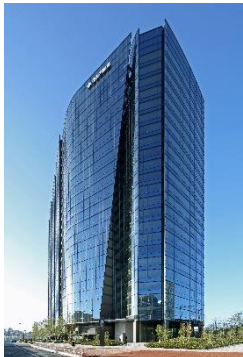
住友不動産 大崎ガーデンタワー