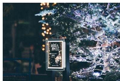
ライブを記念してオリジナルプレートも設置