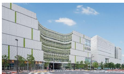
住友不動産 ショッピングシティ 有明ガーデン