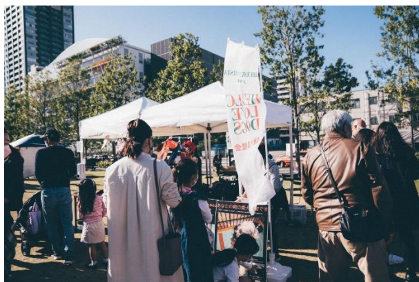
保護犬里親活動をする団体ブースのテント