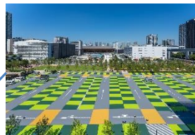
スポーツエンターテイメント広場