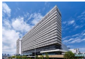
ホテル ヴィラフォンテーヌグランド 東京有明