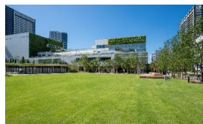
有明ガーデンパーク