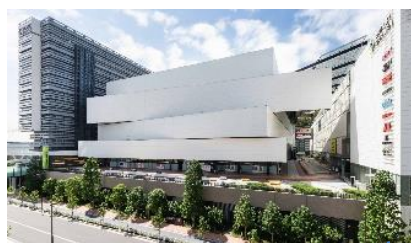
東京ガーデンシアター