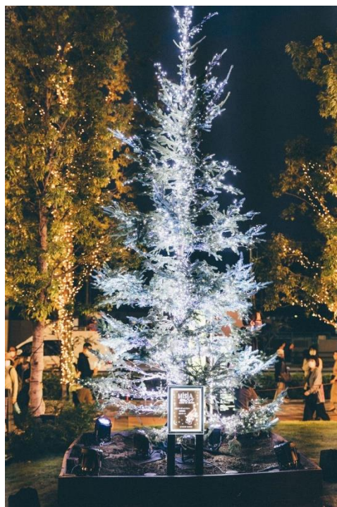
星空のようにライトアップされた『MISIAの木』

『MISIAの木』はモミの木の仲間です。現在高さは5mほどで10年で10mまで成長する予定です。