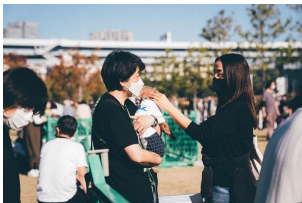
保護犬と交流をする参加者