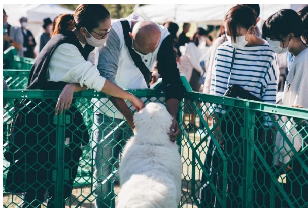
大型犬から小型犬と様々な保護犬が集まる