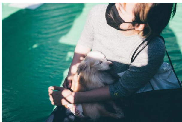
参加者に抱っこされて安心した表情の保護犬