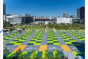
スポーツエンターテイメント広場