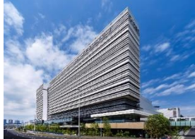
ホテル ヴィラフォンテーヌグランド 東京有明