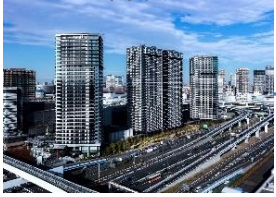
シティタワーズ東京ベイ