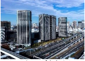
シティタワーズ東京ベイ