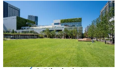
有明ガーデンパーク