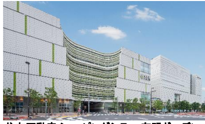
住友不動産 ショッピングシティ 有明ガーデン