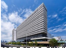
ホテル ヴィラフォンテーヌグランド 東京有明