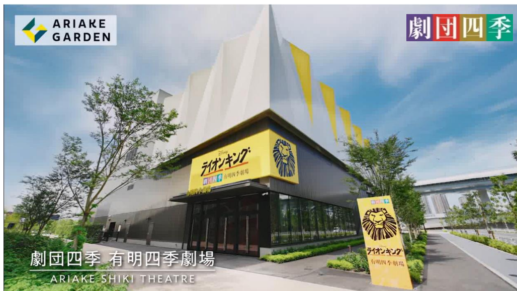
劇団四季専用劇場／有明四季劇場外観

「有明ガーデン」では、今後も有明に住まう人々のコミュニティ形成の中心施設になるよう、継続的に街づくりを進めていくだけでなく、“湾岸エリアの賑わい創出”の中心エリアに位置する施設として、「台場」「豊洲」など周辺エリアとの施設連携を図りながら、臨海副都心・湾岸エリアを広く発展させていく街づくりを目指してまいります。