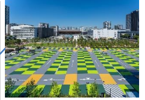
スポーツエンターテイメント広場