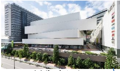
東京ガーデンシアター