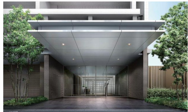
<エントランスイメージ>