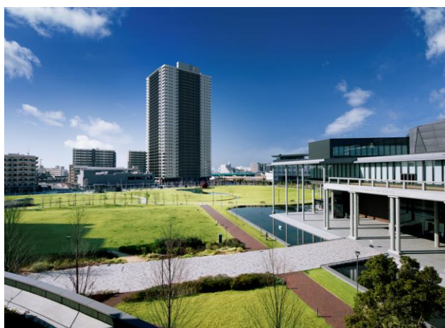
〈シティタワー金町・竣工写真〉