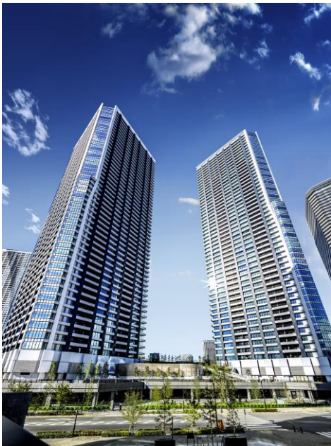
<ドゥ・トゥール・竣工写真>

両物件の共通点として、規模のメリットを活かした充実した共用施設・サービスがあげられます。「ドゥ・トゥール」では、コンシェルジュサービス、ビューラウンジ&バーラウンジやスパ(温浴施設)などが揃い都心リゾートに相応しいサービスを楽しむことができます。「シティテラス小金井公園」は、自然を身近に感じられる閑静な住宅環境において、天体観測を楽しむ屋上ビューテラスや DIY ルームなど 17 種の共用施設をご用意するとともに、コミュニティ形成を育む「オーナーズカルチャーサービス」を導入予定で、一次取得者層だけでなく幅広い世代からご評価を受けました。