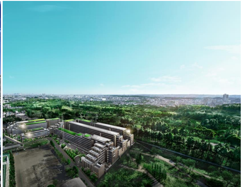
<シティテラス小金井公園・完成予想図>