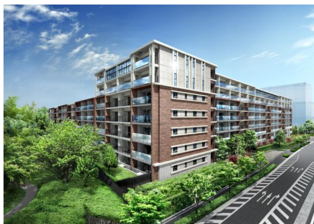
〈シティテラス横濱仲町台式番館・完成予想図〉