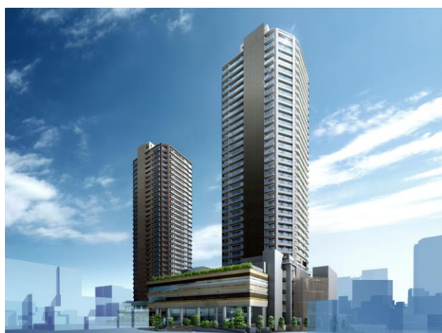
〈シティタワー国分寺ザ・ツイン・完成予想図〉