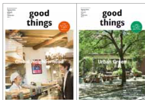
「good things」表紙(両面)イメージ

当エリアは1986年のアークヒルズ開業を機に、国内外を代表する企業が集積する国際的なビジネス拠点へと進化。以降、地下鉄開通などの交通インフラ整備とともに、泉ガーデン、赤坂インターシティ、アークヒルズ 仙石山森タワーなどの大規模開発が進みました。この30年、従来からもつ歴史的・文化的背景と共に、再開発で育まれた豊かな緑によって、国際色豊かで良好な住環境を有する都心でも希少なエリアへと大きく変貌。現在も六本木三丁目東地区プロジェクトや赤坂インターシティ AIR(赤坂一丁目プロジェクト)など、複数のプロジェクトが進行中です。