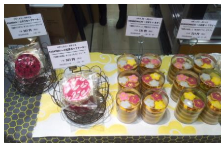
＜商品イメージ写真＞

日時:平成28年3月31日(金)～4月3日(日) 平日10時～20時、土日10時～14時