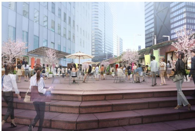
<新宿住友ビル公開空地・イベントイメージ画像>