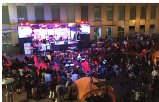
<ライブステージ・イメージ>

「Sakura Stage」では、ランチタイム(12:00～13:00)とディナータイム(18:30～20:30)に桜をキーワードとしたライブステージを行います。1st.weekは、Bossa Nova、POPS、Big band etc... 2st.weekは、JAZZ NIGHTを予定しております。