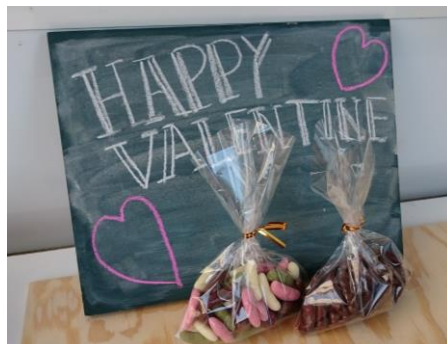
柿の種チョコレート