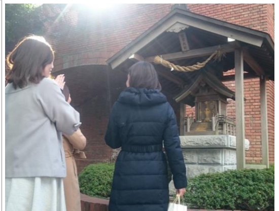
出雲大社（東京分祠奉斎）に お参りする女性