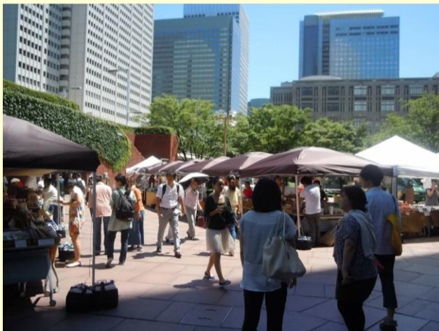
<賑わう新宿マルシェの様子>

三角広場では、昨年 8 月から毎週水・木曜日(平日)に「新宿マルシェ」を開催しており、約 20 店舗が出店しています。