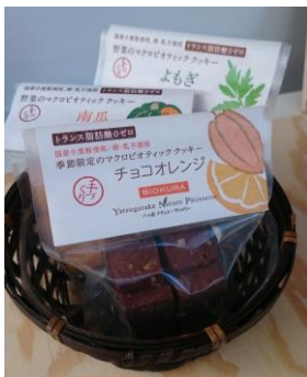
マクロビクッキー チョコオレンジ味