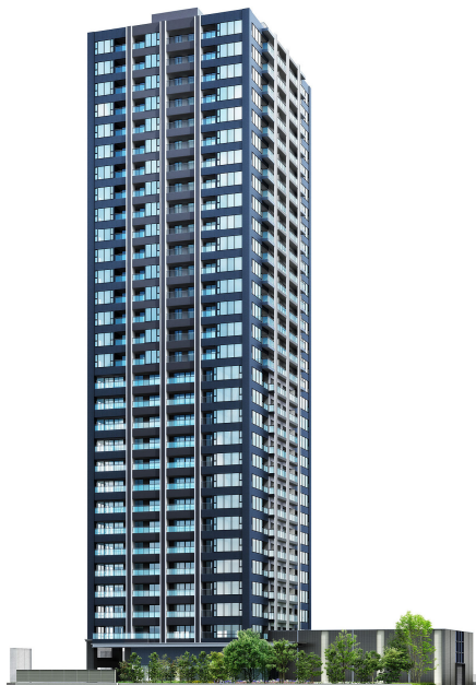
＜建物外観完成予想パース＞

刻々と変化する街の表情、空の表情までも外観デザインに取り込めるよう、ダークブルーのタイルをベースにガラスを多用した都会的でスタイリッシュなファサードです。また、超高層タワーならではの眺望を座ったままでもご堪能いただけるように、足元から天井近くまで壁一面に窓を設けた「ダイナミックパノラマウインドウ」を多くの住戸で採用しています。