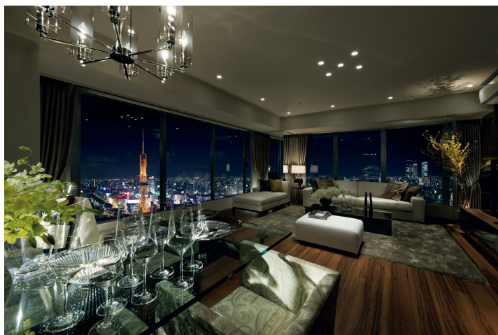
＜現地 31 階相当のイメージ＞