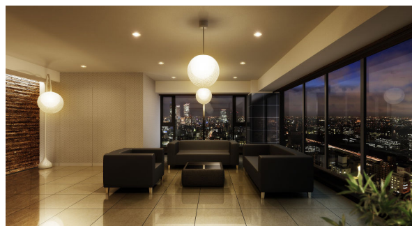
＜「泉スカイラウンジ」完成予想パース＞