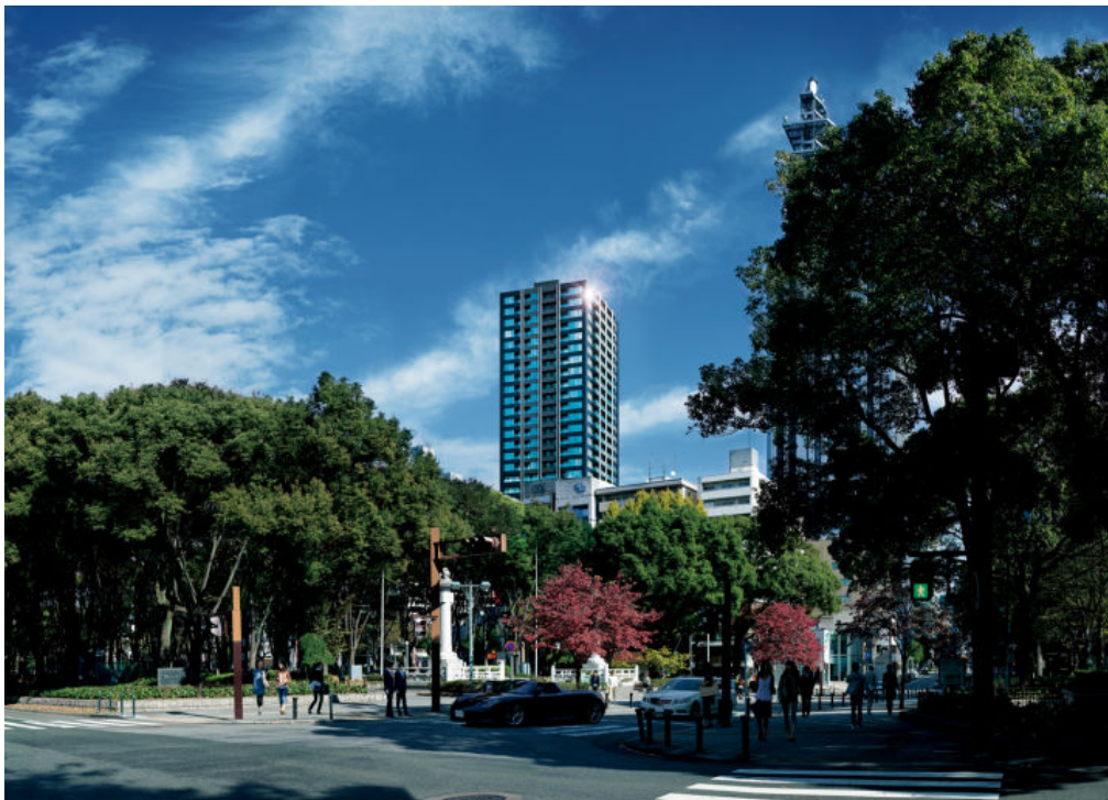
「久屋大通公園」周辺から見た「シティタワー名古屋 久屋大通公園」※

※ 現地より約240mの地点から撮影した写真（2010年10月）と「建物完成予想パース」を合成