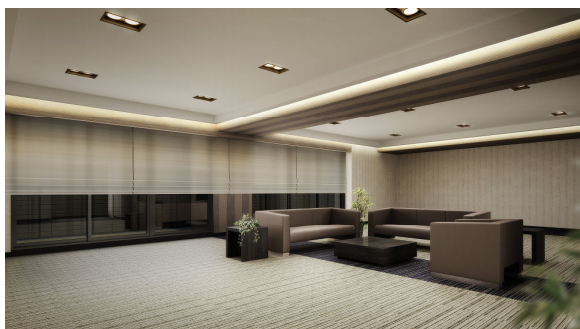
＜「泉サロン」完成予想パース＞