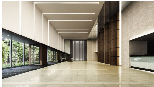
＜エントランスホール完成予想パース＞

マンションの顔となるエントランスホールは天井高約6mの開放的な2層吹き抜けの空間で、心地良い BGM が優雅な雰囲気を醸し出します。迎賓の場として、2階には待ち合わせや商談など、多様な用途でお使いいただけるオープンスペース「泉サロン」、20階には官庁街や名駅方面の眺望が楽しめる「泉スカイラウンジ」(有料施設)と、2つのラウンジを設けています。また、プライバシー性・快適性の高い内廊下を採用するなど、共用部はホテルライクな空間を印象付けています。