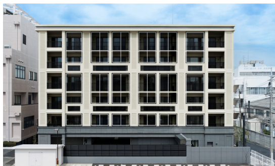
<シティハウス志村三丁目ザ・レジデンス>

いずれも今後の“シティハウス”ブランドのスタンダードとなる “時を重ねるほどに、心地よさが深まる住まいの創造” をベースにしつつ、都心近接という立地特性に見合う都会的でスタイリッシュな外観デザインを特徴としています。