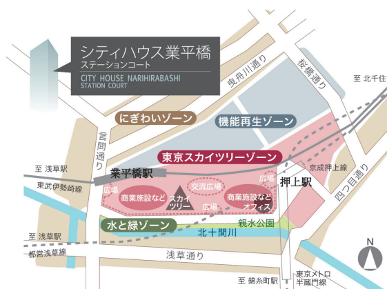
【押上・業平橋地区まちづくりグランドデザイン計画図】(2025年度完成予定) 参考文献:墨田区地域振興部東京スカイツリー観光推進担当発行資料より(2011年2月現在)

あわせて最寄りの「業平橋」駅は「とうきょうスカイツリー」駅に改称（予定）となり、改札口の増設やプラットホームの拡張などのリニューアル工事が行われて利便性が向上します。さらに墨田区では押上・業平橋地区において「下町文化創世拠点」をコンセプトに「東京スカイツリー」を核とした街づくりを推進しており、下町文化と先進機能を融合させた街づくりが整備される予定です。