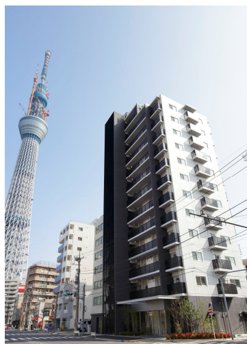
<シティハウス業平橋ステーションコート>