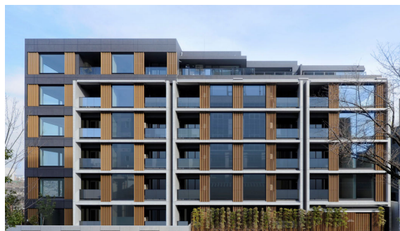
<シティハウス新宿戸山>