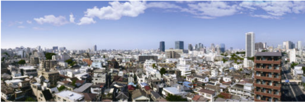
現地 12 階相当からの大崎方面の眺望（2009 年 10 月撮影）

開放感と閑静な見晴らしを満喫していただけるように3戸全てが第一種住居地域の広がる西側にバルコニーや大きな窓（主開口）を設けています。1フロアに3戸という独立性の高さに加え、各住戸が隣住戸と壁で接しないプランニングにより、全ての住戸で通風と採光に優れた3面開口を実現し、プライバシー性の確保と開放感の高さを両立しています。