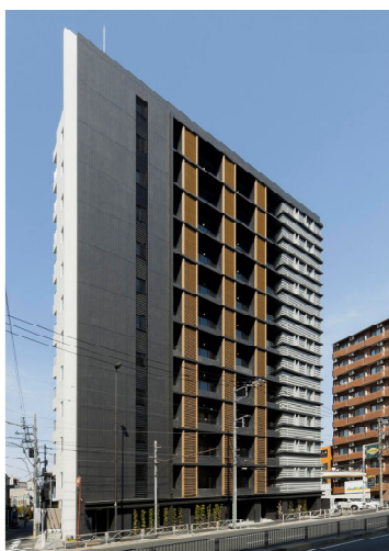
<シティハウス南品川>