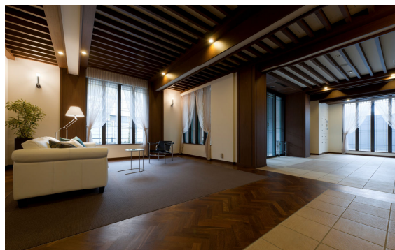
＜エントランスホール＞