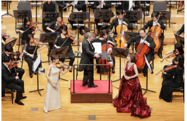
『第115回クリスマスステップコンサート』(東京公演)の様子 『第116回クリスマスステップコンサート』(大阪公演)の様子