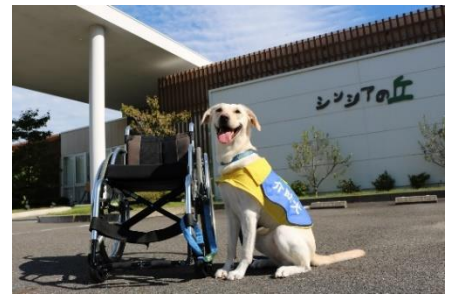
介助犬のイメージ写真

当日は、介助犬育成・普及のための募金箱を会場に設置します。「ステップコンサート」では、1995年1月17日に起きた阪神・淡路大震災から義援金活動を始め、2004年以降は、社会福祉活動のため「介助犬の育成・普及」に少しでもお役に立ちたいと会場で募金活動を行っております。皆様より寄せられた募金は、社会福祉法人日本介助犬協会へ寄託し、介助犬育成・普及のための活動に活用します。