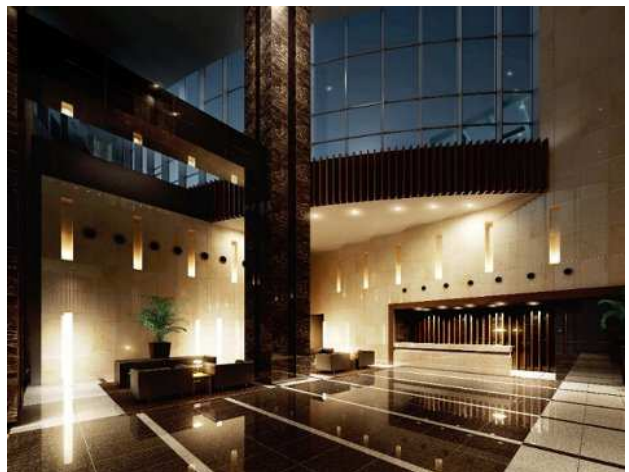
E棟エントランス完成予想 CG