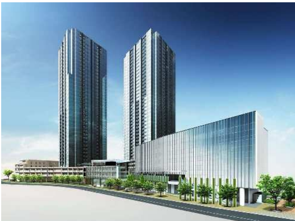
「大崎ウエストシティタワーズ」完成予想 CG