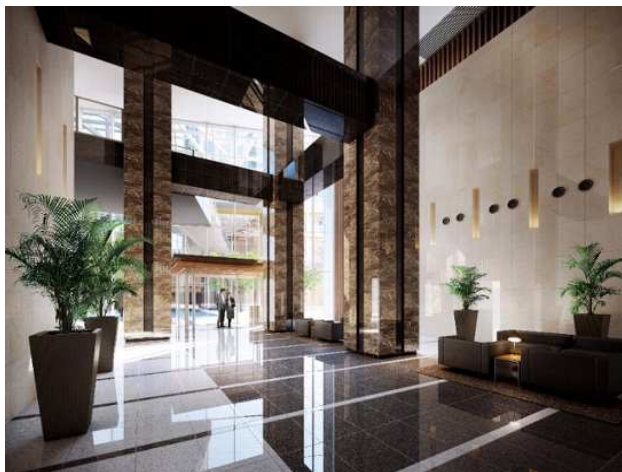
W棟エントランス完成予想 CG

各棟エントランスのフロントには、きめ細やかにサービスを提供するコンシェルジュが常駐。宅配便やクリーニングサービス、タクシーの手配のほか、館内ゲストルーム等のご予約も承る予定です。