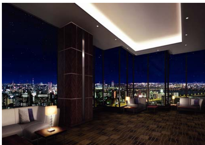
【9階 スカイエントランス】